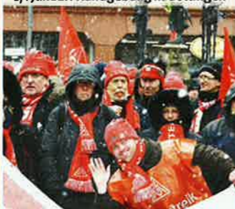
17. Januar: Kundgebung in Göttingen