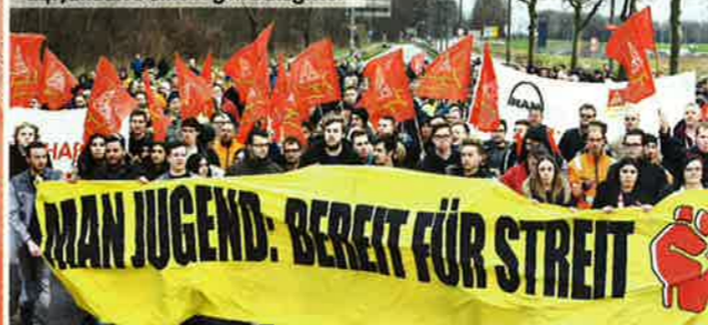
24. Januar: Demozug in Salzgitter