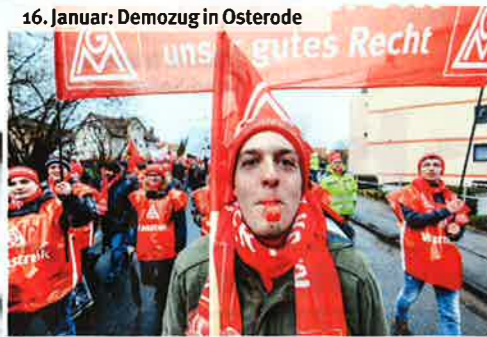
16. Januar: Demozug in Osterode