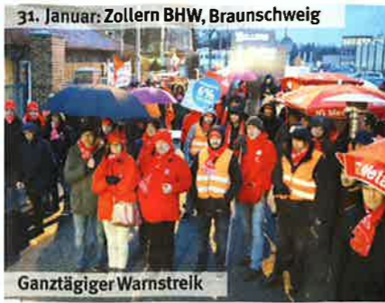
31. Januar: Zollern BHW, Braunschweig