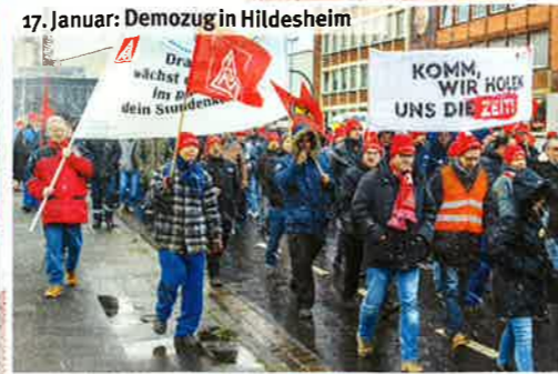
17. Januar: Demozug in Hildesheim