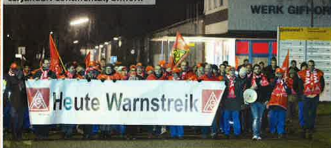
11. Januar: Continental, Gifhorn