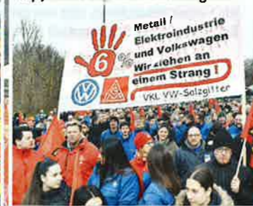
24. Januar: Soli-Aktion in Salzgitter