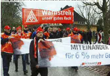
24. Januar: Soli-Warnstreik in Lüchow